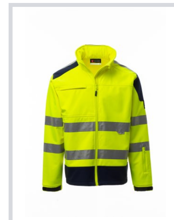
JAUNE FLUO/BLEU MARINE