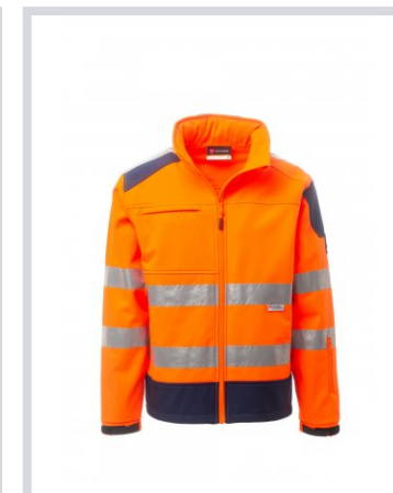
ORANGE FLUO/BLEU MARINE